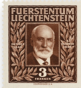
Vorst Johannes II 1940

In de volgende twee eeuwen bleef de passie van de vorsten van Liechtenstein voor het verzamelen ongebroken. De algemene catalogus met schilderijen uit 1878 bevat 1451 kunstwerken. Een belangrijk keerpunt kwam in 1938, toen een deel van de collectie die in Wenen werd tentoongesteld en in 1896 was gecatalogiseerd door de Berlijnse museumdirecteur Wilhelm von Bode (1845-1929), van Wenen werd overgebracht naar het gerestaureerde kasteel in Vaduz.