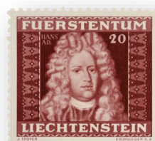
Vorst Johann Adam 1941

Vorst Johann Adam Andreas (1657–1712) volgde het advies van zijn vader voorbeeldig op en gaf een stevige impuls aan de toekomst van de verzamelingen. In het centrum van Wenen, niet ver van de Hofburg, liet hij een door de Italiaanse architect Domenico Martinella ontworpen, groot stadspaleis bouwen, waarin hij o.a. de galerie onderbracht. Deze vorst kocht een flink aantal van de werken van Peter Paul Rubens en van onder zijn leiding en toezicht in diens atelier vervaardigde kunstwerken. Tegenwoordig beschikken de Vorstelijke Kunstverzamelingen over de grootste Rubens-collectie in particuliere handen. De vorst schakel-