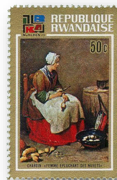
Jean Siméon Chardin (1699-1779) De keukenmeid In 1952 verkocht aan de National Gallery, Washington DC Rwanda, 1973

Vanaf het midden van de jaren zeventig begon de huidige regering de vorst Hans-Adam II de collectie voortdurend uit te breiden. Dit is niet in de laatste plaats te danken aan het financiële succes van LGT Bank, die eigendom is van de vorstelijke familie. De aankopen van kunsthistorische bijzondere objecten namen na het jaar 2000 sterk toe. De duurste aankoop tot nu toe was het 'Badminton Cabinet', een Italiaans luxe meubelstuk ingelegd met halfedelstenen, dat