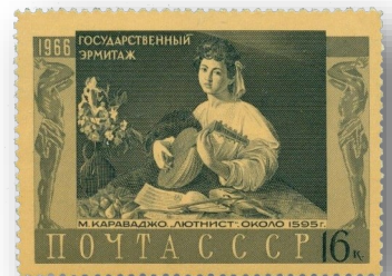
Caravaggio, De luitspeelster Rusland 1966

De luitspeelster is vanaf de rug gezien geportretteerd met een hoge mate van precisie, eigen aan de stijl van de Italiaanse schilder Orazio Gentileschi, een van de meest getalenteerde schilders in de stijl van Caravaggio (1571-1610), die zelf ook een schilderij aan het thema wijdde. Aan de bladmuziek die op tafel ligt, zou kunnen worden afgeleid dat de musicienne aan het oefenen was. Het was niet het enige instrument dat ze bespeelde, want op tafel liggen ook een viool, een cornetto en enkele blokfluiten. De minutieuze weergave van haar jurk zou later door Nederlandse schilders worden bestudeerd en verder worden geperfectioneerd. Het schilderij werd in 1697 aangekocht door Marcantonio Franceschini in opdracht van vorst Johann Adam Andreas van Liechtenstein (1657-1712) van de rijke koopman Girolamo Cavazza uit Bologna. In 1962 werd het door vorst Franz Josef II verkocht via kunsthandel Feilchenfeldt in Zürich aan de National Gallery in Washington DC.