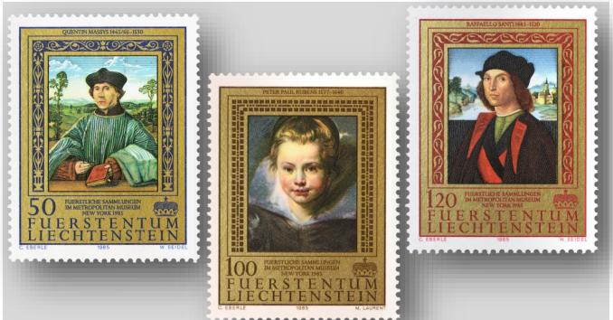
De eerste van de grote reistentoonstellingen in het Metropolitan Museum in New York, 1985

Er is destijds veel kritiek geweest op vorst Franz Josef II. Men vond dat hij het aloude familiebezit verkwanselede, maar men kan zich afvragen of dat wel zo is geweest. Met pijn in het hart heeft de vorst de beslissingen tot verkoop moeten nemen om het voortbestaan van zijn uitgebreide familie te redden. Zijn liefde voor de kunst is goed te zien in het besluit om weer kunst aan te kopen toen de financiële situatie dankzij rigoureuze ingrijpen van zijn zoon, de toenmalige erfprins Hans-Adam, die zich met grote inzet wierp op de sanering van het inkomen van het vorstenhuis. De eerste grote aankoop na de periode van min of meer gedwongen verkopen was de de olieverfschets "Mars en Rhea Silvia" van Peter Paul Rubens in 1977, een ontwerp van de meester voor zijn grootformaat, in 1710 al door vorst Johann Adam Andreas I van Liechtenstein (1657–1712) aangekochte schilderijen. Tegenwoordig worden werken uit de verzamelingen vaak uitgeleend voor tentoonstellingen. Die traditie begon na de sanering in