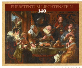
Jordaens, "Wie die Alten sungen"

in 2004 bij Christie's werd geveild voor 19 miljoen pond (24 miljoen euro). Een jaar eerder had de vorst een mansportret van Frans Hals gekocht voor 2,9 miljoen pond, oorspronkelijk eigendom van de nazaten Rothschild, geveild bij Sotheby's in New York, als vervanging voor het in 1969 door zijn vader verkochte schilderij, dat nu in de tentoonstelling hangt, dat helaas maar een zwakke vervanging is van het oorspronkelijke doek. Een recente aanwinst is het schil-