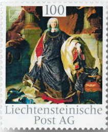
Vorst Joseph Wenzel 2015

de daarbij veelvuldig de Antwerpse kunsthandelaarsfamilie Fouchoudt in die in Wenen een dependance had.