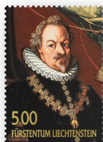
Vorst Karl I 2008

werd gekenmerkt door liefde voor de kunst en grote kennis van zaken. Als opdrachtgever en als verzamelaar is hij betrokken geweest bij de aankoop van Italiaanse kleine bronzen beelden, Nederlandse en Vlaamse schilderijen en andere kunstvoorwerpen.