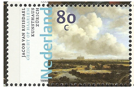
Ruisdael: gezicht op Haarlem (Nederland 1999)