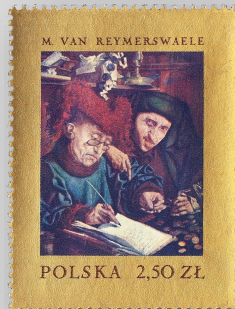
Van de Hebzuchtige Belastinginners van Quinten Massys (uitg. 2015) bestaan diverse kopieën, o.a. een van Remmerswael in de Nationale Gallerie Polen (uitg. 1967)

tin Massys, in 2008 aangekocht door de regerende vorst bij veilinghuis Sotheby's voor ongeveer £ 2 miljoen en een bronzen reliëf van de door Michelangelo beïnvloede Florentijnse beeldhouwer Pierino da Vinci, dat door de hertog van Devonshire werd verkocht voor £ 10 miljoen. Ook op het gebied van de toegepaste kunst worden systematisch collecties aangevuld. Vorig jaar kocht de vorst een uitzonderlijk thee- en koffieservies van de Berlijnse KPM in Egyptische stijl bij Lempertz voor 60.000 euro. Dergelijke aankopen laten zien dat veilingactiviteiten en aankopen die in de handel zijn, elkaar effectief aanvullen. Tot de kunsthandelaars die vorst Hans-Adam II bezoekt, behoren onder meer Daniel Katz en Samuel Dickinson, beiden in Londen, de Weense galerie Sanct Lucas, Rudigier in