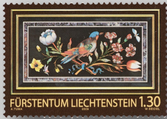
Detail van het Badminton Cabinet, in 2004 voor 24 miljoen euro door vorst Hans-Adam II verworven